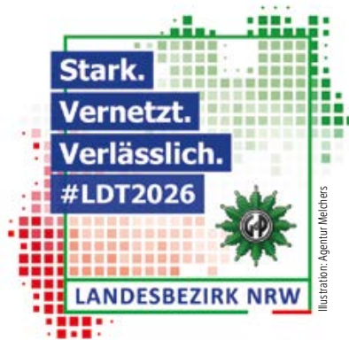
Motto und Logo des Landesdelegiertentages hat die Agentur Melters (Düsseldorf) entworfen.

Über 300 Anträge stehen zur Beratung, darunter dreizehn Leitanträge. Sie greifen zentrale Themen auf, von der Weiterentwicklung der Aus- und Fortbildung über notwendige Verbesserungen in den Direktionen bis hin zu unserem Selbstverständnis als eine Polizei.