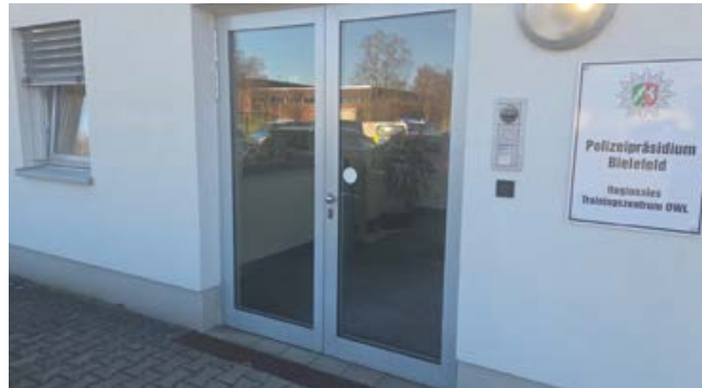
Weil Stellen zunächst nicht nachbesetzt werden sollten, drohten beim RTZ in Bielefeld Betriebseinschränkungen. Druck von der GdP hat das abgewendet.

Zukünftig will die Landesregierung das PAB Tarif mit einer Pauschale berechnen, die sich nur an den Stellen, die die Behörde zugewiesen bekommen hat, orientiert. Allerdings soll das Gesamtbudget nicht zu 100 % freigegeben, sondern bei 93 % gedeckelt