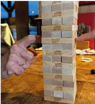
Ein begehrtes Spiel letztes Jahr: Jenga.

Am 15. Oktober ist es wieder so weit: Unser beliebter GdP-Spieleabend steht an! Wir treffen uns im American Diner „Road Stop“ in Mettmann , wo wir ab 18 Uhr einen Raum nur für uns haben. Hier erwartet Euch eine tolle Spielesammlung – von Brettspielen bis zu Kartenspielen ist für jeden was dabei. Gemeinsam können wir in entspannter Atmosphäre den Alltag hinter uns lassen und uns auf eine lockere Runde mit Euch freuen.