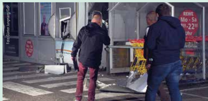
Die Zahl der Geldautomaten-Sprengungen ist deutlich zurückgegangen – aus guten Gründen.

„Wir haben viel Personal eingesetzt und strategische Ziele in den Fokus genommen, um das Problem gezielt zu bekämpfen.“ ■