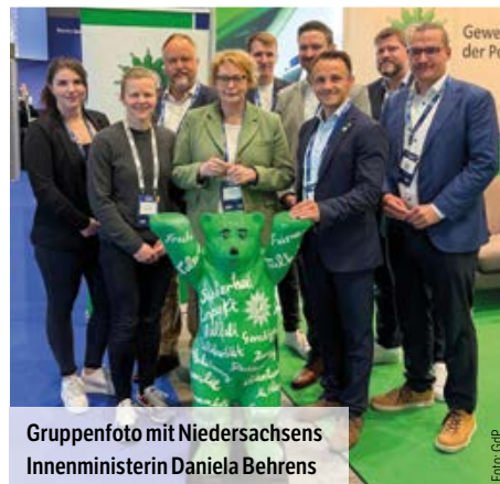
Gruppenfoto mit Niedersachsens Innenministerin Daniela Behrens

nehmen. Für uns waren die beiden Tage in Berlin geprägt von vielen interessanten Gesprächen, neuen Impulsen und spannenden Einblicken in die Polizei der Zukunft. ■