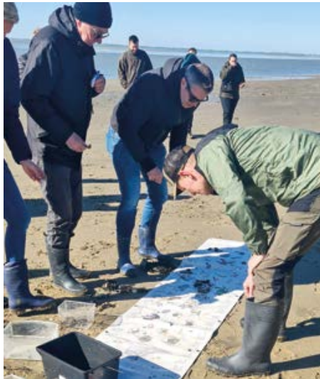
Bei einer Wattwanderung konnten die Teilnehmenden die besondere Tier- und Pflanzenwelt hautnah erleben.

Der Montag begann mit einem theoretischen Einstieg in das Thema Wattenmeer. Dabei wurden die Besonderheiten dieses einzigartigen Naturraums sowie seine Bedeutung als UNESCO-Weltnaturerbe näher beleuchtet. Am Nachmittag folgte eine Hafensrundfahrt, bei der die Teilnehmenden Einblicke in die maritime Seite Wilhelmshavens und den Hafensbetrieb erhielten.