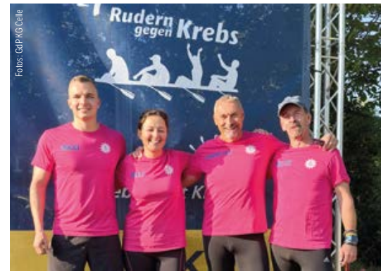
Die KG Celle war 2025 beim Rudern gegen Krebs vertreten.

Nach den Wahlen und dem gemeinsamen Essen wurde auf die Aktivitäten der vergangenen Jahre zurückgeblickt. Gelobt wurde die Teilnahme eines Bootes der KG Celle beim „Rudern gegen Krebs“. Auch bei der nächsten Regatta in 2027 soll die Kreisgruppe wieder mitrudern.