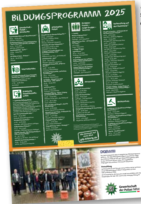
Neue Optik: Das Bildungsprogramm 2025 ist dieser DP-Ausgabe beigelegt.

„Lebenslang zu lernen ist nicht nur möglich, sondern es kann uns auch gesünder, glücklicher und selbstbewusster machen“: Das zeigen neueste Erkenntnisse der Neurobiologie und Lernpsychologie. Die GdP NRW leistet gerne einen Beitrag zu Gesundheit, Glück und Selbstbewusstsein – bitte schön: Unser Bildungsprogramm 2025 liegt, ganz frisch, dieser DP-Ausgabe bei! Anmeldungen sind ab dem 1. Dezember möglich – bitte ausschließlich über die Homepage unter www.gdp.de/nrw/de/bildung/aktuelle-seminare . Wir haben wieder knapp 65 Seminare an rund 20 verschiedenen Bildungsstätten im Gepäck. Ob Vollzugsbeamte, Verwaltungsbeamte, Regierungsbeschäftigte oder unsere Personengruppen Senioren, Frauen und Junge Gruppen: Jede und jeder kann sich wiederfinden!