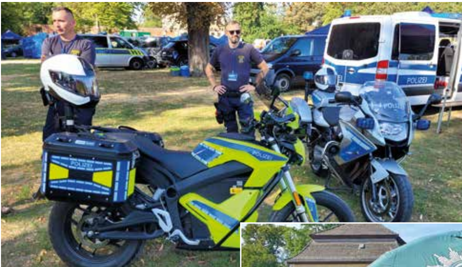
Auch die Motorradstaffel war vor Ort.

ten Gäste, welche zufrieden und glücklich mit Teddy oder Igel im Arm unseren GdP-Stand verließen. Natürlich hatten wir auch Malhefte zur Verkehrserziehung und Informationsbroschüren zu sicherheitsrelevanten Themen dabei, welche sich regelmäßig, so auch an diesem Tag, großer Beliebtheit bei unseren Besucherinnen und Besuchern erfreuen.