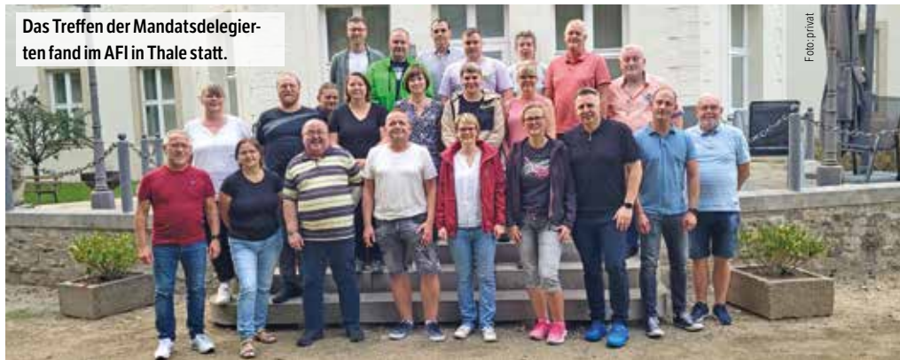
Das Treffen der Mandatsdelegierten fand im AFI in Thale statt.