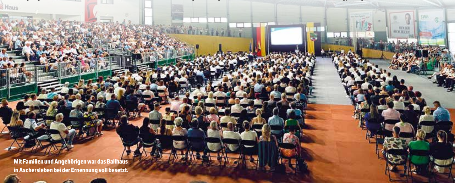
Mit Familien und Angehörigen war das Ballhaus in Aschersleben bei der Ernennung voll besetzt.

Die GdP LSA bietet ihren Mitgliedern eine einzigartige Rechtsschutzabsicherung im beruflichen Bereich, welche nicht durch eine Versicherungsgesellschaft gewährleistet wird, bei der es am Ende nur um Aspekte der Wirtschaftlichkeit innerhalb der Entscheidungsfindung geht. Bei uns entscheiden langjährige, erfahrene Polizeibe-