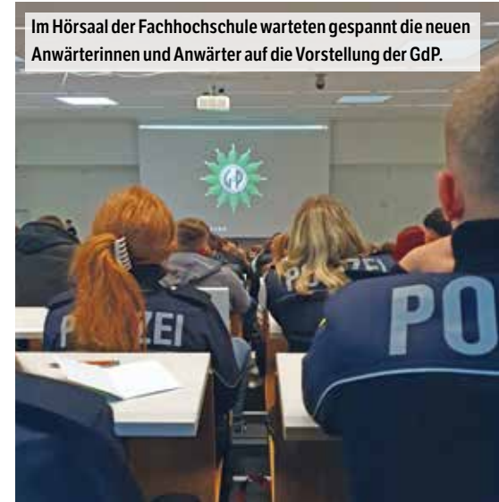
Im Hörsaal der Fachhochschule warteten gespannt die neuen Anwärterinnen und Anwärter auf die Vorstellung der GdP.

schäftigte auf der Grundlage der Rechtsschutzordnung. Dabei bleibt der Rechtsschutzantrag innerhalb der GdP LSA und wird nicht an externe Entscheidungsträger (z. B. Rechtsschutzversicherungen) abgegeben. Der Rechtsschutz wird aus allen Mitgliedsbeiträgen bezahlt. Dieser kleine, aber feine Unterschied macht uns unabhängig von Versicherungsdienstleistern. Wir können Verfahren aus gewerkschaftspolitischen Gründen (z. B. um eine Grundsatzentscheidung herbeizuführen) bis in die letzte Instanz fortführen.