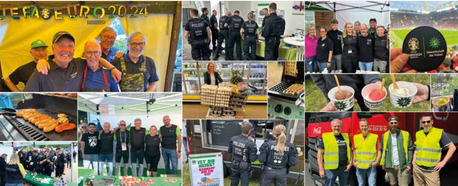
Gemeinsam stark: die GdP NRW im Einsatz bei der EM 2024 – Eindrücke und Momente.