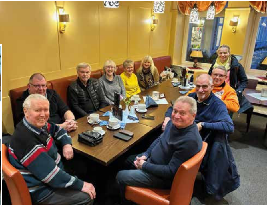
Seniorentreffen im Café Rothe in Schwerin

Kegelrunde und einem weihnachtlichen Drei-Gänge-Menü. Wir nutzten diesen Rahmen, um unsere Jubilare zu ehren.