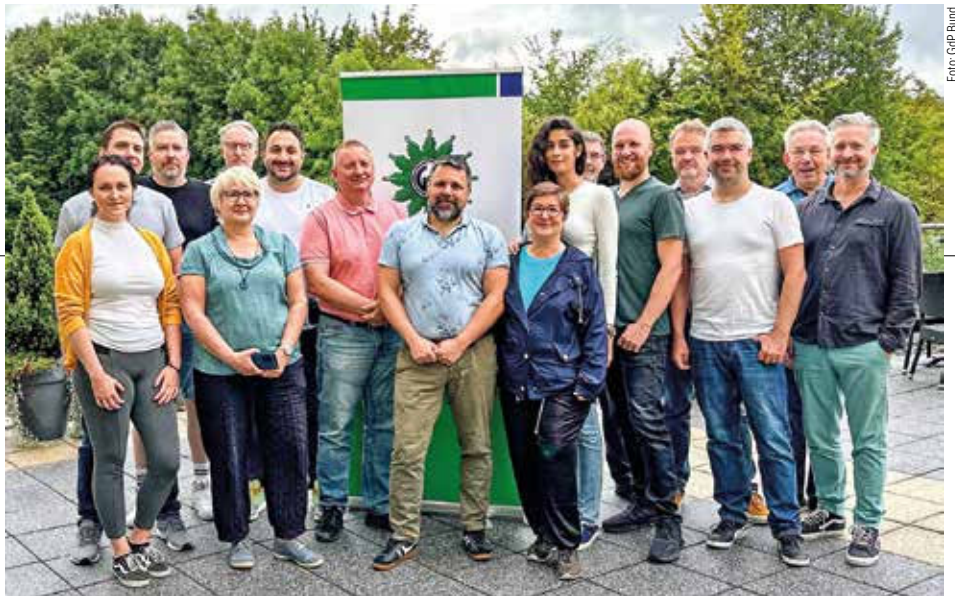
Moni (v. M.) bei ihrer letzten Redakteurskonferenz

Ich habe in meinen unterschiedlichsten Funktionen innerhalb der GdP sehr kostbare, vielseitige, interessante und manchmal leider auch weniger schöne Erfahrungen sammeln