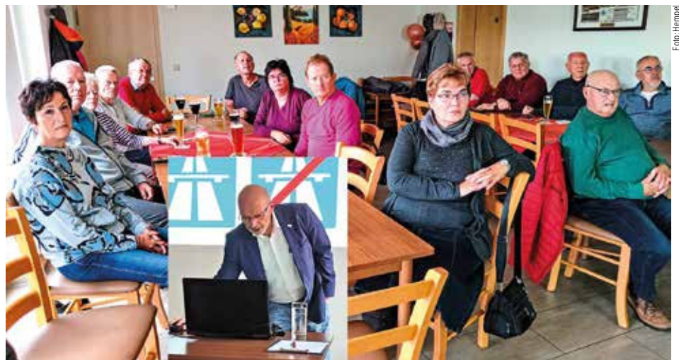
Die interessierten Senioren und der Referent (li. u.)

Während es im letzten Jahr noch um spezielle, den veränderten Witterungs- und Straßenverhältnissen angepasste Fahrweisen ging, drehte sich in diesem Jahr alles um das Thema „Autobahn“. Neben informativen Themen wie Beschilderungen, Geschwindigkeiten und die durchaus unterschiedlichen Bewertungen von Unfällen unter Verkehrs- und versicherungsrechtlichen Aspekten standen insbesondere Verhaltensweisen beim Sicherheitsabstand, beim Überholen/Vorbeifahren, beim Einhalten des Rechts-