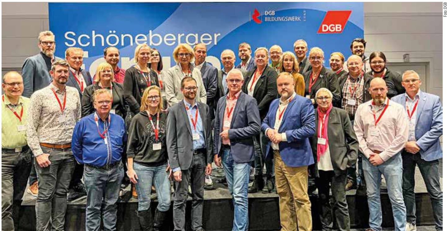
GdP-Vertreter beim Schöneberger Forum 2023

Im Rahmen des diesjährigen Schöneberger Forums wurde zudem der Deutsche Personalräte-Preis verliehen. Der Preis in Gold ging an die Polizeihauptpersonalräte aus Niedersachsen. In einer Gemeinschaftsarbeit aller Personalratsgremien entstand hier ein Bildungskonzept zur Stärkung der demokratischen Widerstandskraft der Beschäftigten. Damit werden Polizisten für den Schutz und die Werte der Demokratie sensibilisiert. Überdies setzen die Interessenvertretungen damit ein klares Zeichen gegen rechtsradikale/rassistische Vorwürfe, die immer wieder gegen die Polizei geäußert werden. Die Laudatio hielt der stellvertretende Vorsitzende der GdP, Sven Hüber, welcher ebenfalls Jurymitglied war. Dieses Projekt wird auch in Thüringen eingeführt und übernommen. ■